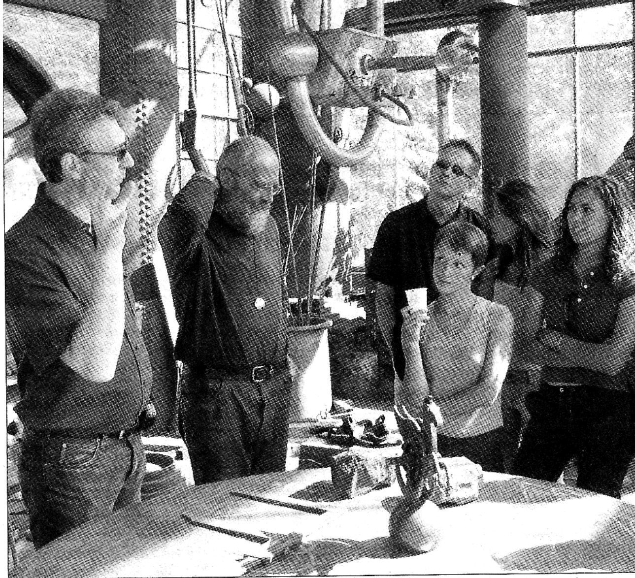
Junge Leute an die Kunst heranführen, auch das wollen die Rotarier

Mit Geld, eigenen Medizinerinnen und Spendenläufen wollen die Rotarier hier konkret helfen und Öffentlichkeitsarbeit betreiben. Beim Fest der Bereitschaftspolizei soll die Breite der Bevölkerung erreicht werden. Dort wollen die Rotarier im Jubiläumsjahr auch ihr traditionelles Behindertenfest integrieren, um den Menschen zu zeigen, dass